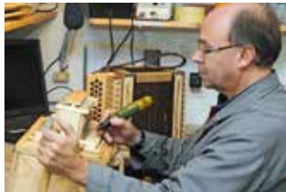
2 Schwyzerörgli-Manufaktur Reist

Sattlerei Blaser GmbH Dorfstrasse 41 Wasen i.E. www.blaser-sattlerei.ch