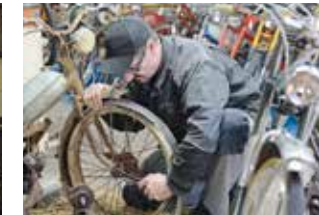
5 Töffli-Oldtimer-Bude Fleusi

Käseerei Fritzenhaus Fritzenhaus Wasen i.E. www.kaeserei-fritzenhaus.ch